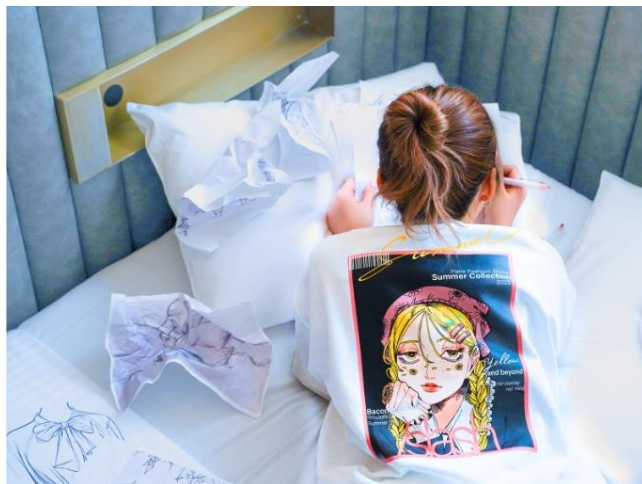
slash 川崎 × nowri 「AKIHO ロングスリーブ T シャツ&ステッカーセット」 4,000 円