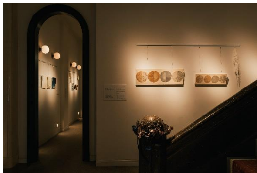
UNWIND HOTEL & BAR 小樽 1 階の展示空間

当ギャラリーでは、1910 年代半ばから 1930 年代にかけて欧米で流行した「アールデコ様式」の建築美が色濃く残っている幻想的な空間で、現代アート作品を鑑賞いただけます。さらに、作品の世界観を味覚や香りで楽しめる「アートペアリングカクテル」や、お気に入りの作品をご購入いただける展示販売なども行っております。