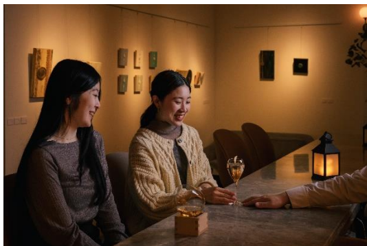
アートペアリングカクテル

当ホテルでは、国内外からのゲストが訪れるホテルの特性を生かした取り組みを行っております。その一環として、季節ごとに北海道にゆかりのあるアーティストの作品を中心に展示し、北海道の文化を世界中に繋げる「UNWIND GALLERY(アンワインド ギャラリー)」を 2022 年 11 月に設けました。