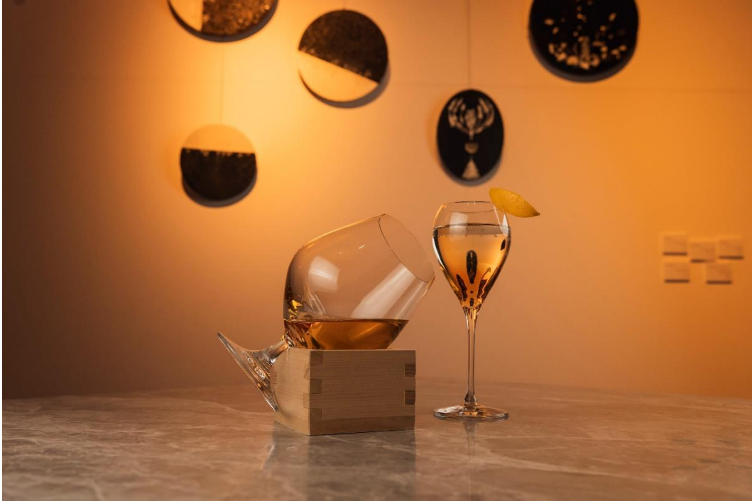
画像左から:「冴ゆる夜(さゆるよ)」、「Pulse in the Afternoon」

ホテルの共用部で展開する UNWIND GALLERY の特徴は、館内のバー「Bar Ignis 小樽(バーイグニス小樽)」もギャラリーの一部として楽しむことです。展示「The Journey Within ～内面への旅～」とホテルの空間を、より多くの感覚で堪能していただきたいという想いから、展示をイメージしたアートカクテルを期間限定で販売いたします。今回は、カクテルを味わいながら自身の内面と向き合える 4 つのキーワードをもとに、2 種類のアートペアリングカクテルをご用意いたしました。