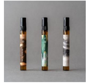
ホテルオリジナルのフレグランスプレー