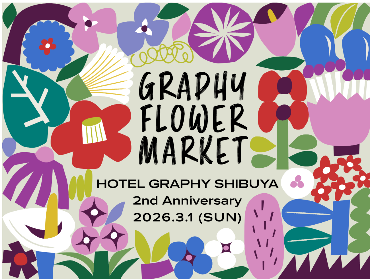
（Ayumi Takahashi によるイベントキービジュアル）

このたび、ライフスタイルホテル「HOTEL GRAPHY 渋谷」にて、2026 年 3 月 1 日（日）に開業 2 周年記念イベント「GRAPHY FLOWER MARKET」を開催いたします。また、本日 2 月 17 日（火）より、開業 2 周年を記念した宿泊プランの予約受付を開始しました。