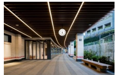
渋谷ブリッジA棟通路