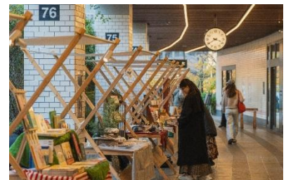
2025年12月開催「SHIBUNAN CANDLE BRIDGE」マーケットの様子

東京各地で愛されるショップやクリエイターが集結するマーケットを開催。季節を彩る生花や産地直送の野菜、お菓子や雑貨など、あなただけのお気に入りを探してみませんか？単にお買い物をするだけでなく、作り手や店主との心地よい会話もこのマーケットの醍醐味です。春の訪れを感じながら、暮らしを彩るアイテムと出会う、豊かなひとときをお楽しみください。