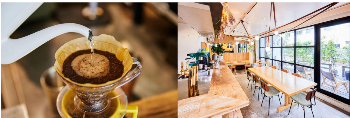
※1杯ずつ丁寧に抽出するハンドドリップコーヒー(左)、カフェ内観写真(右)

■ホテル併設カフェでは、夕暮れの交流時間を楽しむ「NEZU APERITIVO HOUR」を実施中！