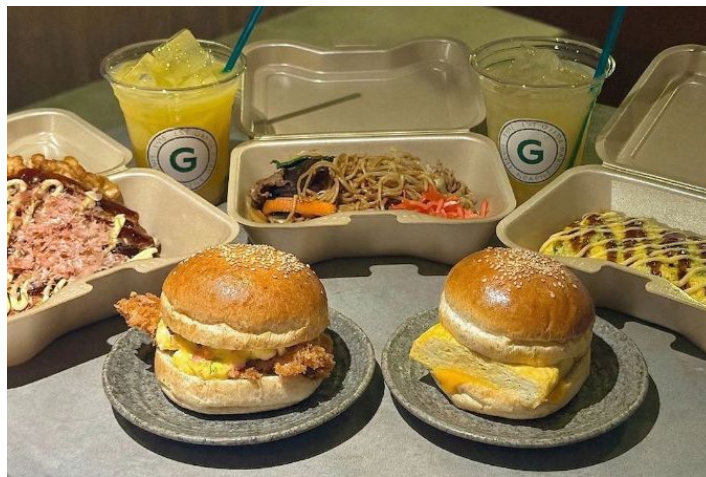
※ホテル併設カフェのイベント限定メニュー

イベント期間中、谷根千の雑貨屋・セレクトショップなどのお店に加え、フードやドリンク、お菓子のお店も「HOTEL GRAPHY 根津」に出店します。お買い物はもちろん、食を通じた体験もお楽しみいただけます。