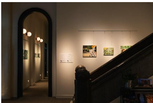
1階ロビー周辺の展示

当ホテルでは、2022年11月より北海道のカルチャーをアートを通じて世界へ発信する場として「UNWIND GALLERY(アンワインド ギャラリー)」を設け、ホテル1階ロビーとBar Ignis 小樽のスペースに、北海道にゆかりのあるアーティストを迎え、季節ごとに異なる表情の展示を行っております。