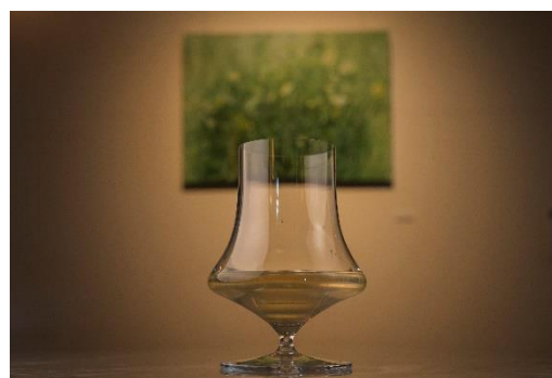
Lucent Petals 1,600円(税込)

今回は、「恋心」のようにそっと胸を揺らす軽やかな高鳴りを、透き通る花びらにたとえたカクテル「Lucent Petals(ルーセントペタルズ)」をご提供いたします。2種類のジンブレンドしたベースに、甘く爽やかな香りが特徴の「エルダーフラワー」と、柑橘のようなフレッシュな香りが印象的な「ベルガモット」のリキュールを加え、北海道産シードルで仕上げた一杯。すっきりとした爽やかさの中に、華やかな余韻が広がる繊細な味わいです。カクテルを味わいながら、お気に入りの作品をゆっくりと見つけていく。嗅覚や味覚でもアートに没入できる、当ホテルならではの体験をお楽しみください。