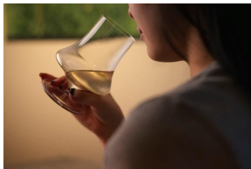
アートペアリングカクテル

当ギャラリーは、1910年代半ばから1930年代にかけて欧米で流行した「アールデコ様式」の建築美が色濃く残る幻想的な空間全体をアートとしてご体感いただけます。さらに、お気に入りの作品をご購入いただける「展示販売」や、作品の世界観を味覚・香りで楽しめる「アートペアリングカクテル」のご提供も行っております。