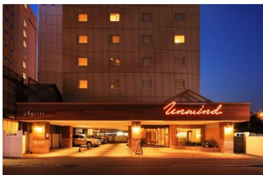
UNWIND HOTEL & BAR 札幌

2026 年 8 月、日光国立公園の深い森と湯元温泉の魅力を背景に、3 施設目となる「UNWIND HOTEL & BAR 奥日光」が、栃木県・奥日光エリアに誕生します。