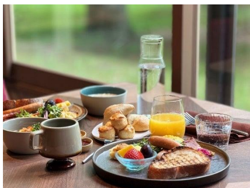
Forest Morning Table

夜のパーティムには、宿泊者向けにドリンクを無料で楽しめるライトインクルーシブサービスを実施します。