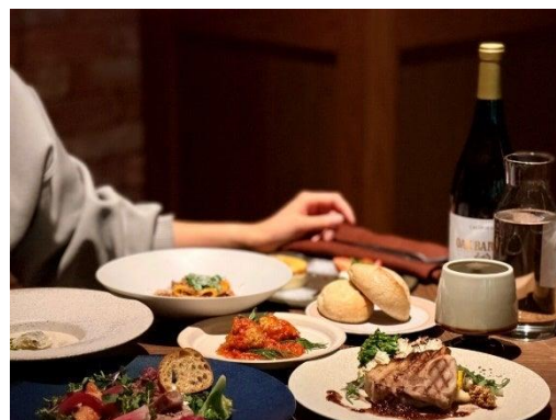
Forest Lodge Dining