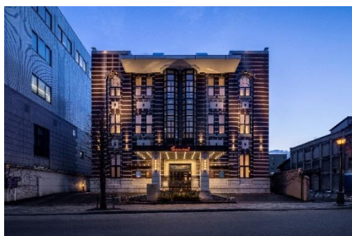
UNWIND HOTEL & BAR 小樽