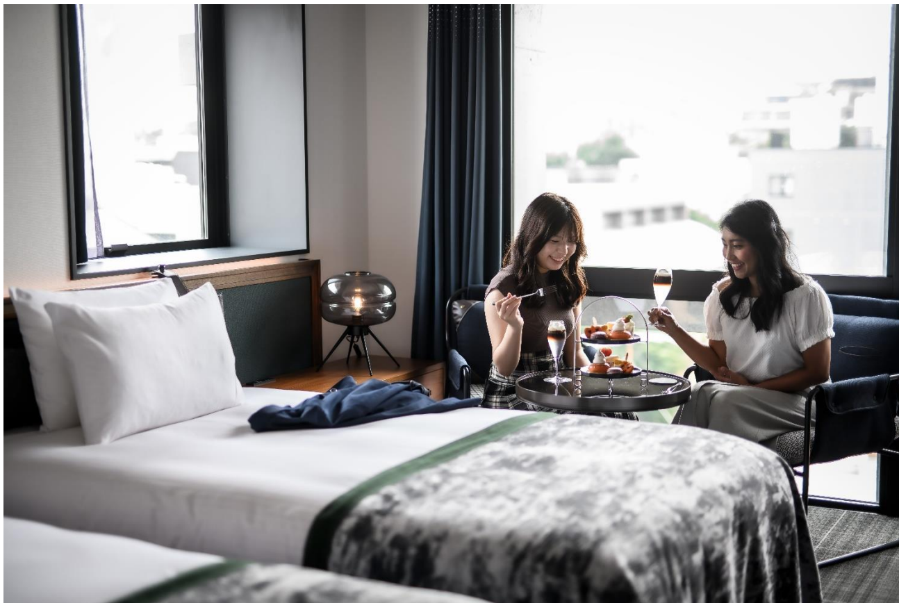
(画像：ライブリーシアターツインルーム)