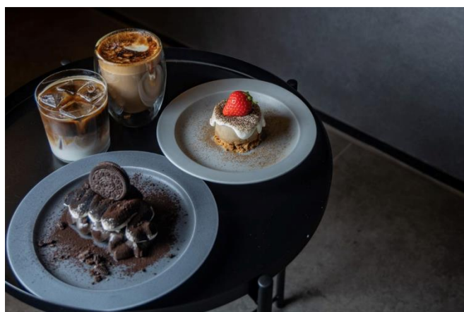
(季節のスイーツに加えて人気の韓国風スイーツも通年販売中)