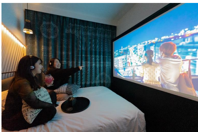
(映画やライブ鑑賞が楽しめる人気のシアタールーム)

【予約 URL】 http://bit.ly/3xmeFLU ※3月1日以降にご希望の宿泊日を設定してご確認ください。