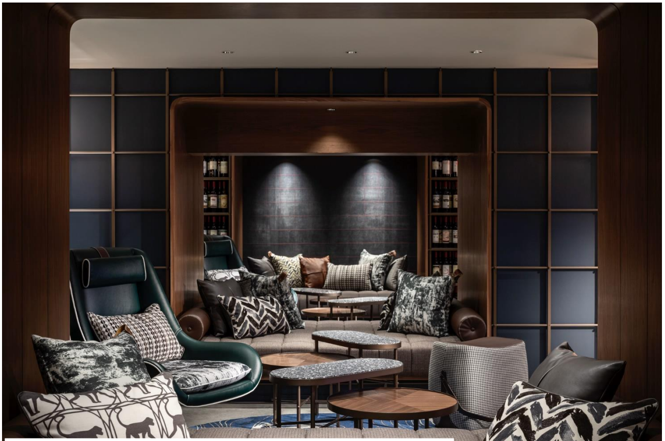
(カフェ利用可能な1Fのロビーラウンジ。吹き抜けは人気の撮影スポット。)