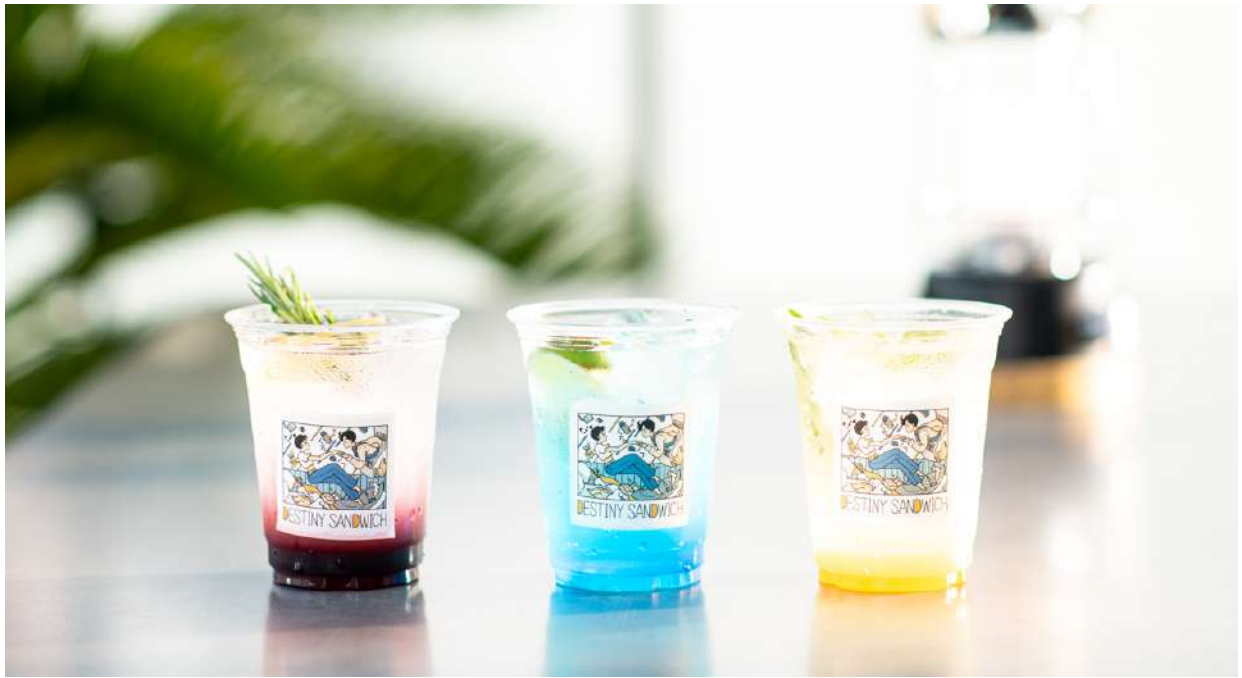
(右からアメリカンレモネード、ノンアルコールジントニック、バジルレモネードサワー)

そして今回は7月12日(水)から販売するサンレモ氏初のイラスト本に slash 川崎のコラボアートが掲載されることを記念して、販売日よりホテル内レストラン「slash cafe&bar 川崎」にて、本イベント限定の新しいコラボメニューにサンレモ氏をイメージして考案したアメリカンレモネード、バジルレモネードサワー、ノンアルコールジントニックの3種に“DESTINY SANDWICH”のステッカーをカップにデザインしたこの期間だけのコラボドリンクを販売。さらに slash 川崎を利用する多くのゲストがホテル滞在中に楽しんでいる“映画”をテーマにしたキャンバス画の展示や“DESTINY SANDWICH”がバックプリントされたオリジナルTシャツやステッカーの2種のグッズを再販致します。