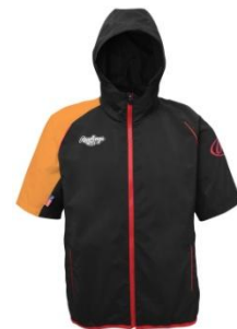
半袖トレーニングジャケット

品番 : AOS5S05 カラー : パープル/ピート、ネイビー/ホワイト ピート/オレンジ、ホワイト/ピート サイズ : S、M、L、O、XO