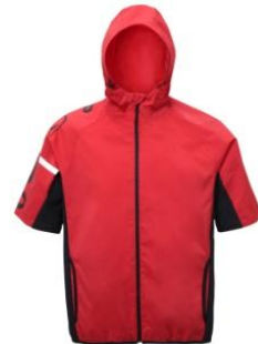
半袖トレーニングジャケット

品番 : AOS5S13 カラー : ホワイト、レッド、ブラック サイズ : S、M、L、O、XO