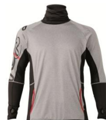
トレーニングシャツ

品番 : AOS5S12 カラー : グレー、レッド、ブラック サイズ : S、M、L、O、XO