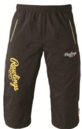
七分丈トレーニングパンツ