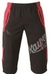
七分丈トレーニングパンツ