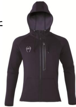
トレーニングパーカージップシャツ

品番 : AOS5S09 カラー : ネイビー、レッド、ブラック サイズ : S、M、L、O、XO