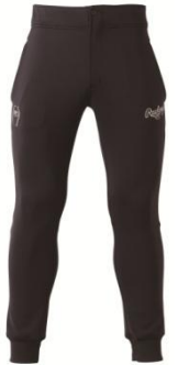
トレーニングパンツ