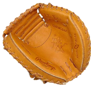
「誠：キャッチャー用」