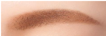
NB ナチュラルブラウン使用