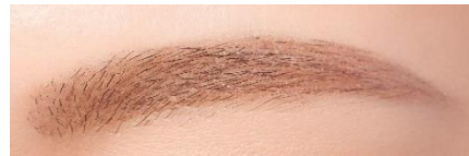
NB ナチュラルブラウン使用