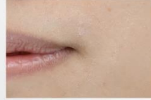
かさつき・粉ふきのある素肌