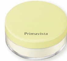
ミモザパール<限定カラー>