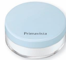
フレンチブルー<限定カラー>