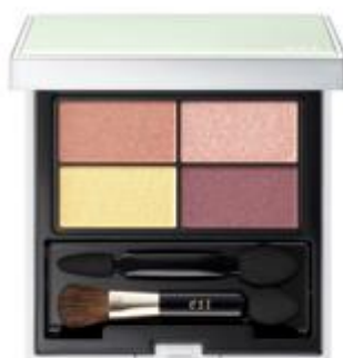
02 : proudness