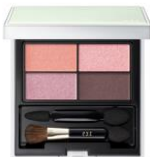
01 : kindness