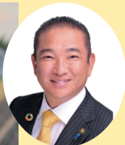
相模原市 本村 賢太郎 市長