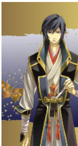
【不器用な義将】 石田 三成