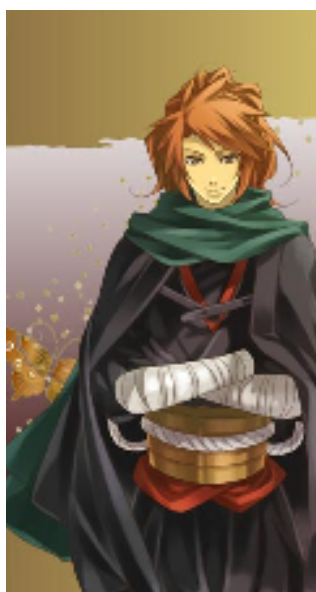
【最強の忍】 服部半蔵