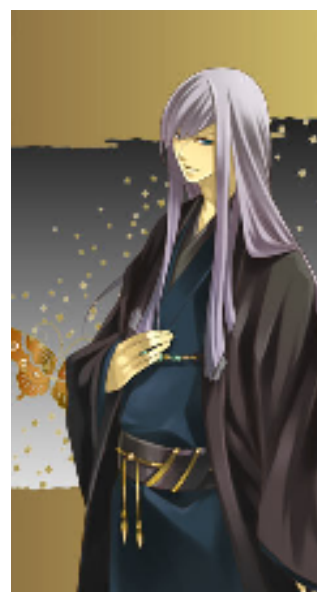
【冷酷知将】 明智 光秀