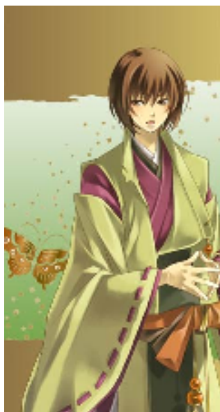
【かわいい小悪魔】 小早川 秀秋