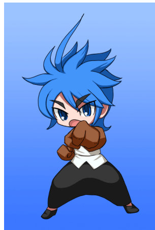
ドラキュリーナと旅をする 【人間・カイン】