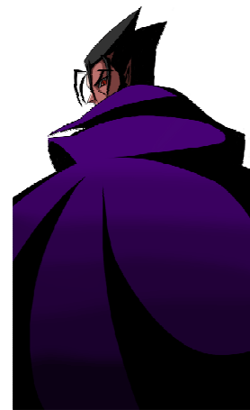
ヒロインの父 【ドラキュラ】