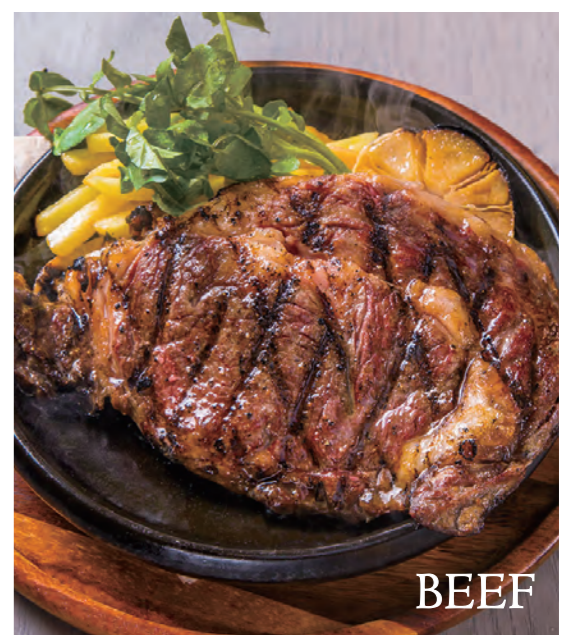
Grilled US Ribeye Roll steaks with Awajishima onion sauce USリブアイロールグリル 淡路玉ねぎソース