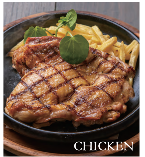
CHICKEN Grilled Daisen chicken steaks with Aomori garlic sauce 大山鶏のグリルステーキ 青森産にんにくのガーリックソース