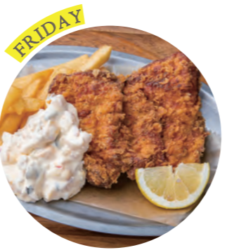
Chicken and Chips made with Daisen Chicken 大山鶏のチキン&チップス