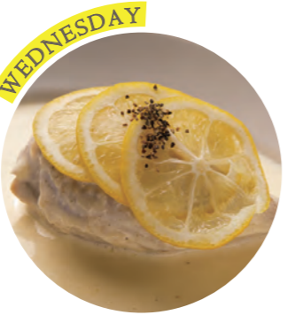
Simmered Daisen chicken with Setouchi lemon cream 大山鶏の瀬戸内レモンクリーム煮