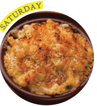
Baked Macaroni and Cheese バイクド マック & チーズ