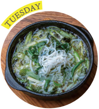
Ahijo of Kyoto Kujo green onion And boiled whitebait 京都九条葱と釜揚げしらすのアヒージョ