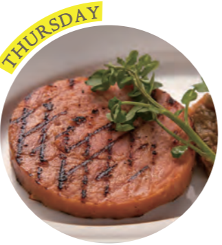
Loin ham pickled in Japanese sake lees with green chili pepper miso ロースハムの粕漬け 青唐辛子味噌