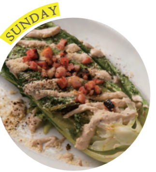
Grilled Caesar Salad with Nagano Romaine lettuce 長野県産ロメインレタスと黒胡椒のグリルドシーザーサラダ