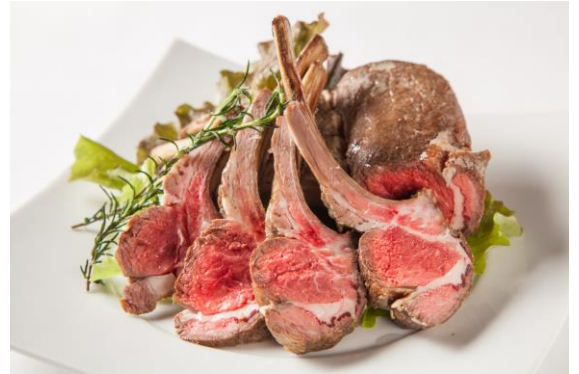
左：肉鍋“肉の塔”／中央上：合鴨とオレンジのマリネ 中央下：肉巻オニオンリング 右：仔羊ラムのオープン焼き