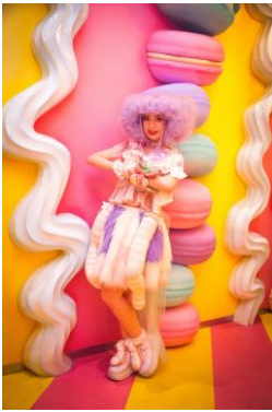
★パステル・ドリーミー・マカロン