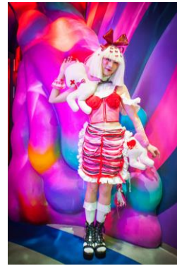
★ガーリー・リボン・エモーショナル