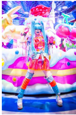
★ビビッド・ポップ・ビタミン