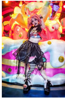
★エッジ・セクシー・ダーク