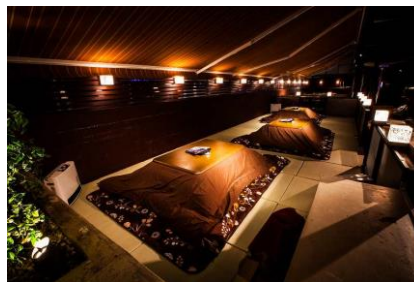
ルーフトップ、暖房付きなので天候や寒さを気にせずご利用いただけます