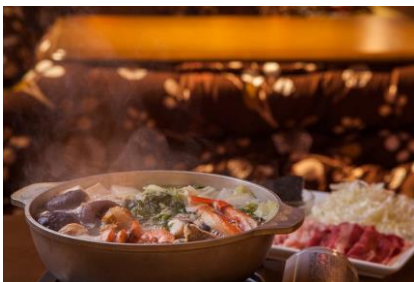
鍋は定番「国産もつ鍋」、ハイブリッドな「海鮮鍋しゃぶ」の2種類をご用意。 デザートはこたつでミカン！

毎年好評の「こたつテラス鍋プラン」が11月1日（木）からスタートします。広いテラスエリアに7台のこたつを設置している他、カラオケ・ダーツ個室もあり、鍋を楽しんだ後に“移動時間ゼロ分”で二次会も楽しめます！鍋は定番「もつ鍋」の他、海鮮たっぷり鍋の後に、豚しゃぶしゃぶが楽しめるオリジナル鍋「海鮮鍋しゃぶ」をご用意しております。また女性には可愛い和柄のはんてんも貸出しているので、寒さを気にせず鍋を堪能いただけます。外なのに寒くない、この不思議な感覚はまるで露天風呂！？ただ鍋を食べるだけではないアクティビティな感覚が楽しめる他にはない空間です。外で鍋を食べる醍醐味をぜひ一度体験ください！