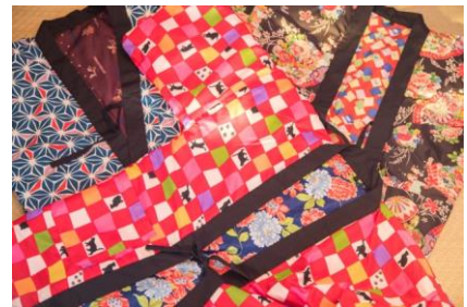
女性限定！可愛い和柄はんてんを着れば身も心もぽかぽかになれる♪ ※男性用もございます