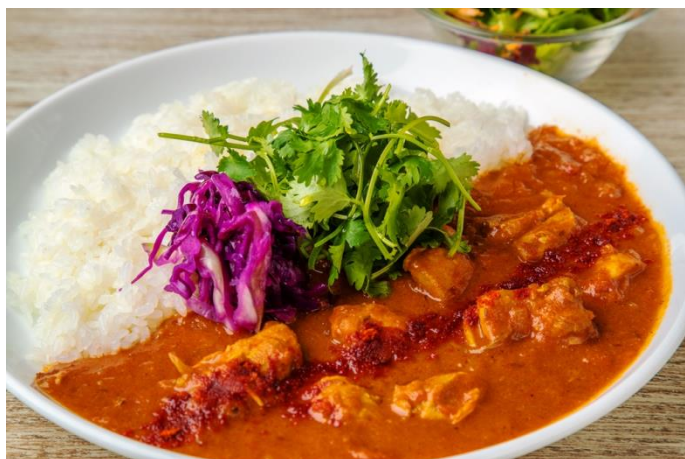
GLASS DANCE 八重洲

絶妙な火入れにより、中心部まで美しく紅色に染まったローストビーフを惜しげもなくたっぷりと盛り合わせた上に、甘辛く煮つけた牛肉、さらにそのヘルシーさで近年注目を集める馬肉をトッピング。見た目を裏切らないパワーチャーージ丼です。