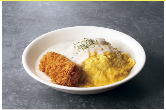
カニコロオムライス～ホワイトクリームソース～ 910 円

カツカレー×オムライスのハイブリッドメニュー。手のひらほどの大きなカツが鎮座する見た目インパクトも充分。豚肉には疲労回復に効果があると言われるビタミン B 群が含まれているので、頑張り時のエネルギーチャージにピッタリです。