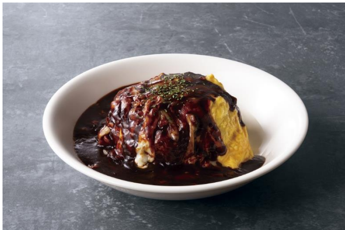
とろーりチーズのオムライス～デミグラスソース～ 840円

未目麗しき半熟卵オムドレスに、香味野菜の旨みが溶け込んだ濃厚なデミグラスソースととろけるチーズが絡むシンプルながら間違いのない組み合わせ。まずは押さえておきたい定番トッピングです。