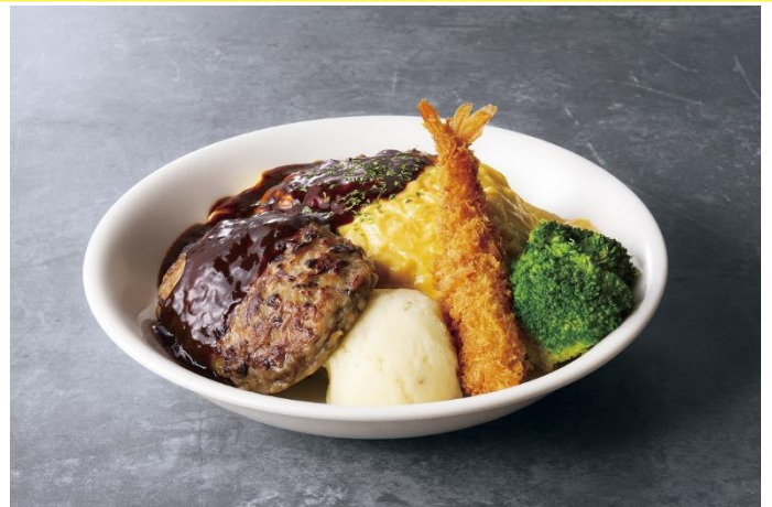
大人様オムライス～デミグラスソース～ 1,370 円

卵の黄色、トマトの赤、ブロッコリーの緑、明太クリームソースのピンクと、色どりも豊かなオムライス。主食にビタミンたっぷりの緑黄色野菜が加わった栄養バランスもバッチリのワンプレートです。