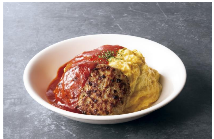
ハンバーグオムライス～トマトソース～ 980円

未目麗しき半熟卵オムドレスに、香味野菜の旨みが溶け込んだ濃厚なデミグラスソースととろけるチーズが絡むシンプルながら間違いのない組み合わせ。まずは押さえておきたい定番トッピングです。