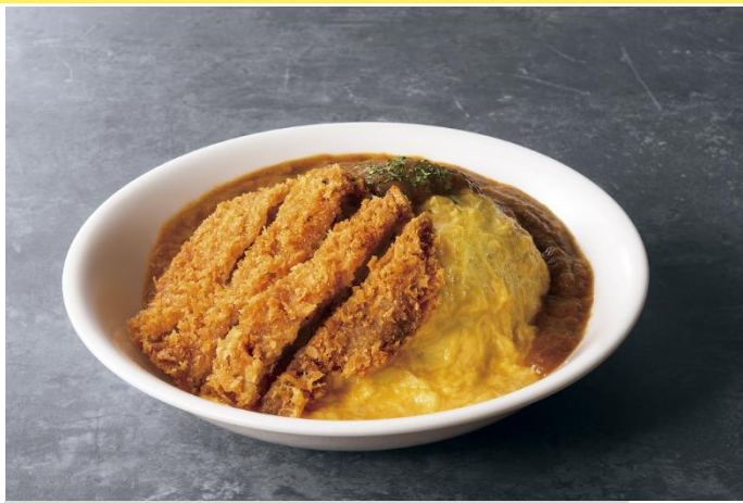
ポークカツカレーオムライス～欧風カレーソース～ 940 円

カツカレー×オムライスのハイブリッドメニュー。手のひらほどの大きなカツが鎮座する見た目インパクトも充分。豚肉には疲労回復に効果があると言われるビタミン B 群が含まれているので、頑張り時のエネルギーチャージにピッタリです。