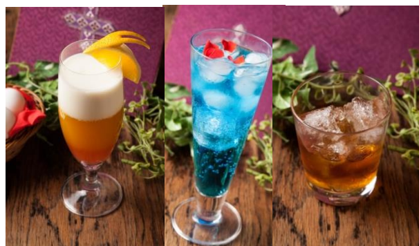
(左から)ラパンズピエーゼ/パスハの夜明け/マザーオブロゴス…各 980 円