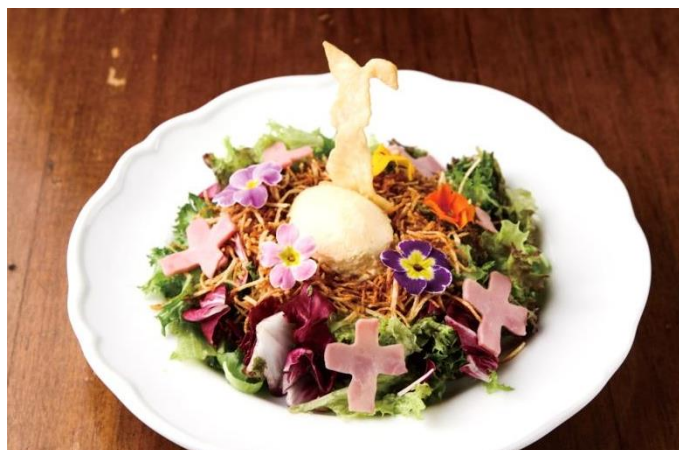
ラムランプのグリル ～ピノ・ノワール風味のマスタードソース 1,580 円→

海外では、イースターにはラム肉を食べて復活をお祝いします。シンプルにグリルしたラム肉を、華やかなピノ・ノワール風味のマスタードソースでお楽しみください。