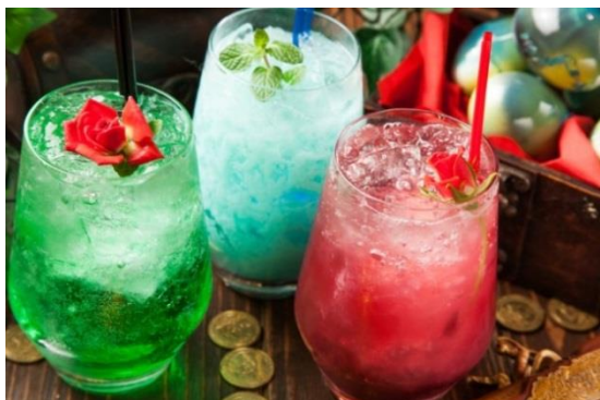
(左から)シークレットガーデン/カリビアンエッグ/ヒップホップバニー…各 980 円