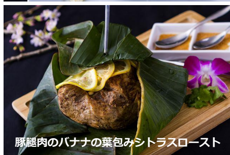
豚腿肉のバナナの葉包みシトラスロースト