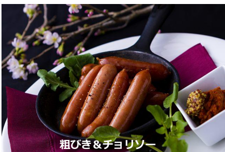
粗びき&チョリソー