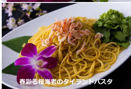
春彩る桜海老のタイランドパスタ