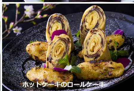
ホットケーキのロールケーキ