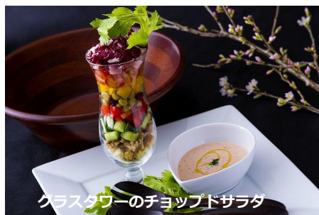
グラスタワーのチョップドサラダ