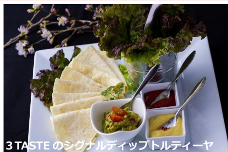
3 TASTE のシグナルディップトルティヤ

es ではビールによく合うエスニックテイストの料理をご用意しております。前菜からビアパーティーの雰囲気が楽しめる「3 TASTE のシグナルディップトルティヤ」や「粗びき&チョリソー」、NY発の日本でも流行中のチョップドサラダをグラスに入れた「グラスタワーのチョップドサラダ」、春を感じる「春彩る桜海老のタイランドパスタ」、メインとして「黒 BEER でマリネした豚腿肉のバナナの葉包みシトラスロースト」、デザートはオリジナルの「ホットケーキのロールケーキ 揚げたバナナのブリュレと共に」など、お腹もしっかり満たされるラインナップとなっております。春は少しシックに、桜とともに大人のビアガーデンをお楽しみください。5月末まで実施いたします。