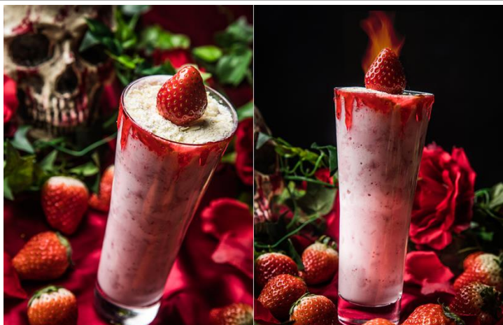
「#ブラッディーキャンドル ～闇夜に揺らめく灯火～」