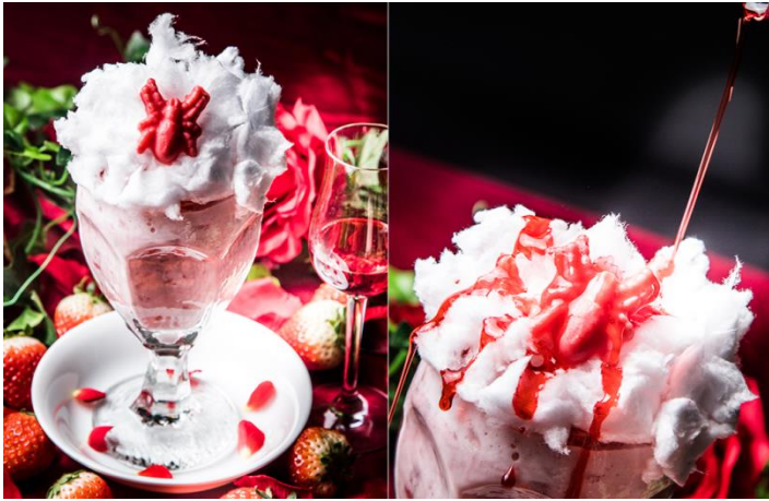
「#モンスターベリー ～蜘蛛の巣に潜む魔物～」