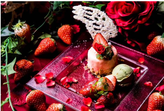
「#ヴァージンウィング ～漆黒を愛した穢れなき少女の翼～」