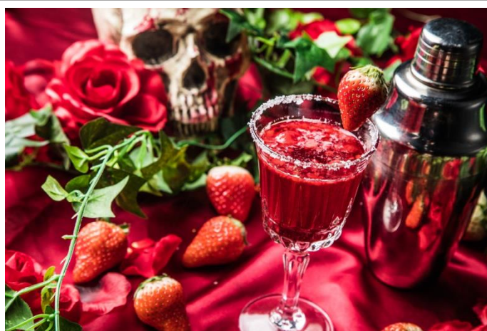
「#ストロベリーブラッド ～伯爵の盃～」

苺を用いた料理は数あれど、燃える苺は魔術が掛かったこの館でこそ実現する奇跡。伯爵の魔術に魅了されたなら、貴女の秘かなる願いはこのカクテルを通して叶うはず…。クラッシュアイスとなった苺とホワイトチョコレートの禁断の組み合わせは、甘美な酔いが回り過ぎる危険度大。