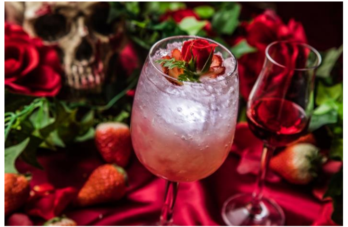
「#ヴァンパイアキス ～薔薇を染める血のくちづけ～」

グラスに張られてしまった蜘蛛の巣は、怪しげな何者かを覆い隠している様子。血の色のシロップを注げばその正体が暴かれる。それは果して…!? サプライズを楽しんだらジューシーな苺の実にヨーグルトを合わせた爽やかな甘さをゆっくり味わって。