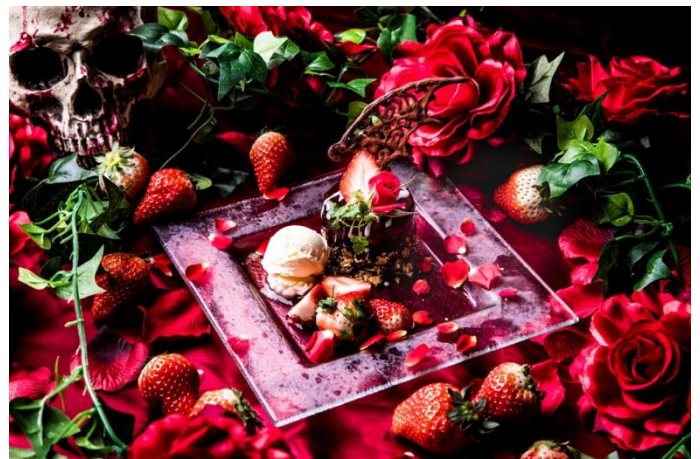
「#ダーティーウィング ～漆黒を纏う穢れし者の翼～」

“マケドニア風”との意を持つ、イタリア風フルーツポンチ「マCHEDONIA」に仕立てた苺があしらわれたデザート。ほんのりピンクに色づいたマスカルポーネチーズのムースがかわいらしい風情の「#ヴァージンウィング」と、ハイカカオの濃厚な味わいにうっとりするような「#ダーティーウィング」。白・黒両方の翼を手にして…。