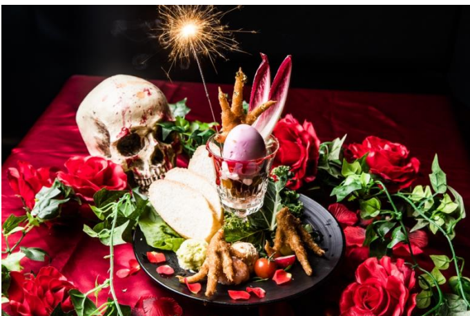
「#ヴァンパイアカフェ 特製鶏パフェ ブラッディーフェニックス～漆黒に刻まれし不死鳥の爪痕～」