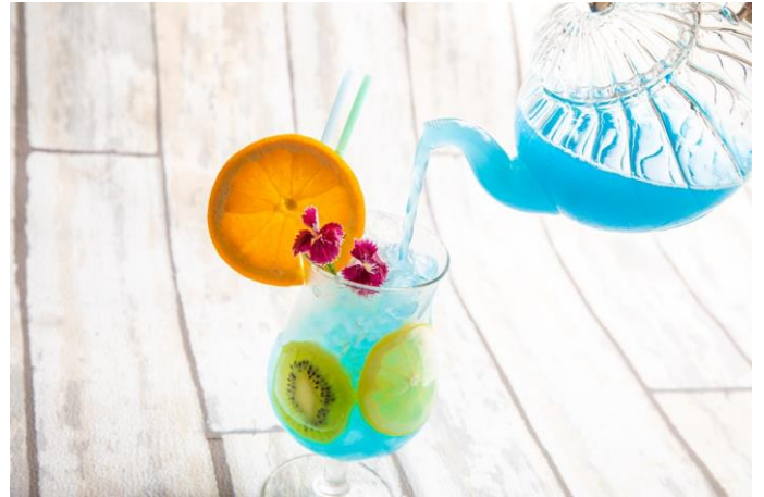
マッドハッターのリトルマジック

URL： https://www.dd-holdings.jp//shops/alice/meikyuginza