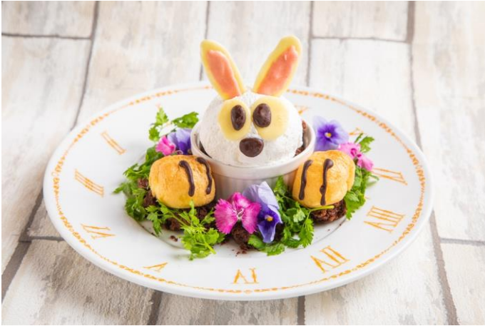
ホワイトラビットのゆめふわクレームダンジュ

アリスを不思議の国へと誘う白うさぎ。お茶会用に秘かに開発していた（!?）食後にゆっくり味わいたくなるようなデザートとドリンクで満を持してエントリー。甘さと苦さ。対照的なメニューは両方要チェックです。