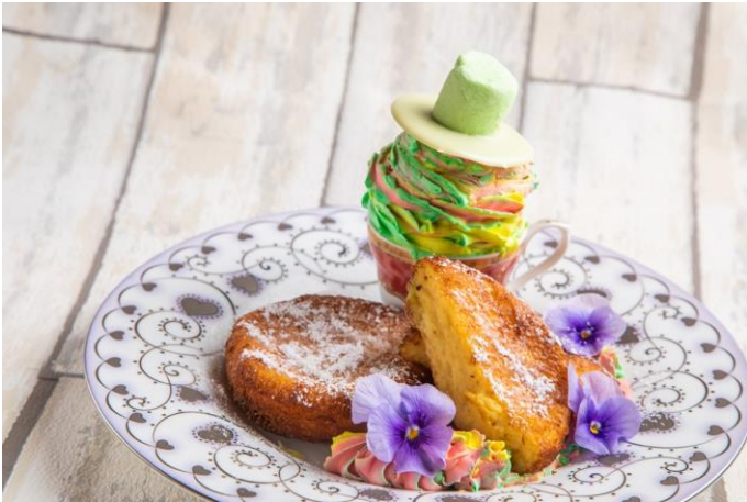
【舞踏の国のアリス伝説メニュー・奇跡の復活！】迷宮の国のプディングケーキ～お気に入りの帽子を添えて～ 850 円

お祭り好きのマッドハッターは真っ先にエントリー！流行のレインボーカラーを取り入れたスイーツやムービージェニックなドリンクなど、“インスタ映え”を意識したメニューを取りそろえ、自信満々の様子です。