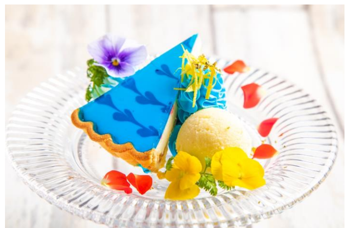
アリスの Secret Heart

涙の海で歌っているかのようなアリスの姿がかわいらしい、グラスデザート。真っ白なパナコッタの上にはブルーキュラソーのムースとジュレ、さらにレモンのジュレも加えて、見た目通りの爽やかな味わいに仕上げています。