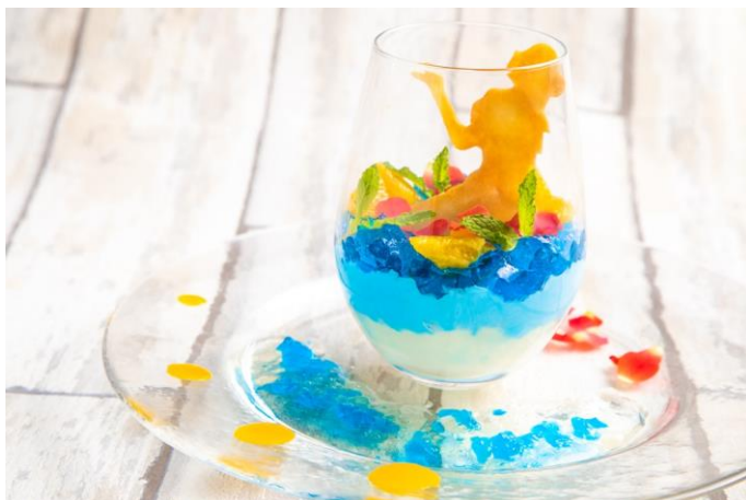
涙の海に溺れるアリス

不思議の国に迷い込んで以来、身体が大きくなったり小さくなったりと大忙しのアリス。涙の海で溺れてしまった時のエピソードをモチーフに、涼しげな色合いのデザート&ドリンクを生み出しました。前向きなアリスらしいメニューです。