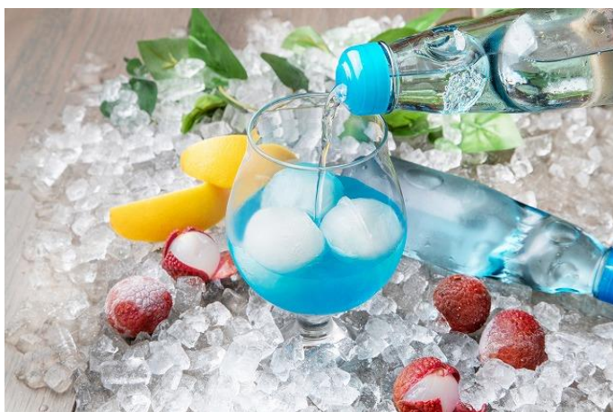
■ソルティ ライチアイスボール 1,200円 アイスボール×モエアイス 1,800円