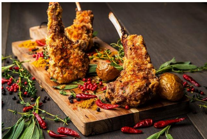
■スパイス ラムチョップ ～薫る江戸前七味～ ポテト付 1本 800円 / 3本 1,800円