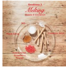
③Melting (とろける) Sweets & Cinnamon

気分を高めてくれるシナモンとクリームブリュレのマリアージュでとろけるような甘い香りのごほうび。