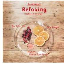
②Relaxing (おちつく) Sakura & Orange

体を芯からあたためるジンジャーと相性ぴったりのアップルティーの香りで体も心もポカポカに。