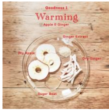
①Warming (あたたまる) Apple & Ginger

紅茶のいいところを最大限に引き立てる、「あたたまる」、「おちつく」、「とろける」、「すっきりする」、「おぎなう」といった5つのホットアレンジメニューです。気分やコンディションにあわせてお好きなアレンジティーをお選びください。