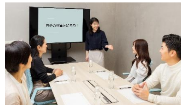
「適正飲酒セミナー」イメージ

※お問い合わせの際は、団体名、セミナー開催の目的、開催候補日時、会場地をお知らせいただきますようお願いいたします