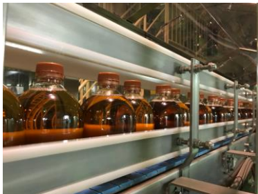
<キリンビール横浜工場のペットボトル製造ライン>

販売が好調なペットボトル商品の製造ラインを新設することで製造能力を確保し、お客様の需要に柔軟に対応できる生産体制を構築します。