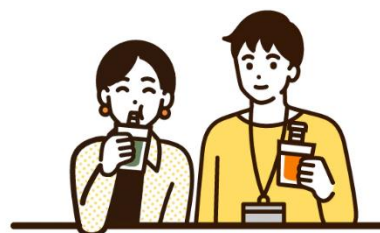
ウェルネススタンド

・「KIRIN naturals」に関する Web サイト（企業向け）： https://k-naturals.jp/