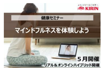
セミナーイメージ

※3 WHO（世界保健機関）が公開している「健康と労働パフォーマンスに関する質問紙（Health and work Performance Questionnaire）」