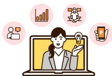
ウェルネスストア

キリンビバレッジでは、企業の健康経営トータル支援サービスとして、「KIRIN naturals」を展開しています。「KIRIN naturals」は、動画・e ラーニング・サーベイなどの多彩な機能と分析支援で、施策立案から効果検証が可能な「ウェルネスストア」と、従業員の健康的な食習慣をサポートする、飲料や食品の置き型サービスの「ウェルネススタンド」の 2 プランを展開し、企業の課題に合わせて、最適なソリューションを提案しています。「ウェルネスストア」は、企業からの多数の要望を反映させ、2022 年 12 月に大幅にコンテンツ内容を刷新しました。2019 年 1 月より展開を始めて、2023 年 1 月時点では 475 拠点に導入されています。今後もお客様のニーズに対応するためコンテンツの充実に取り組み、企業の健康経営のサポートを行っていきます。