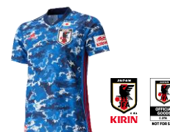
聖獣麒麟入り アディダス サッカー日本代表 2020 レプリカ ユニフォーム