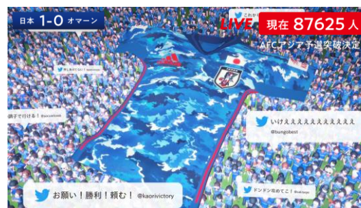
▲超巨大ユニフォーム出現