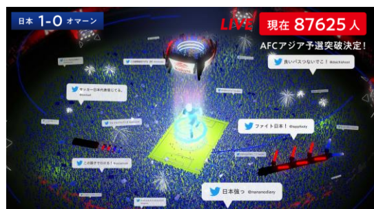
▲超満員となるあつまれ!応援スタジアム