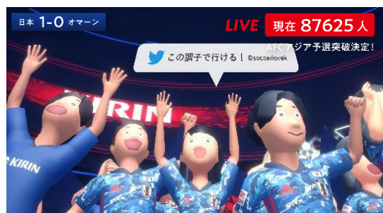
▲ゴールや勝利に喜ぶ応援アバター