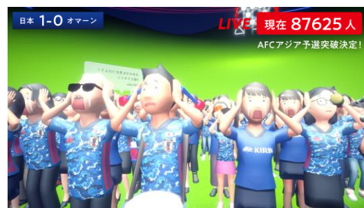
▲失点やピンチに一齐に頭を抱える応援アバター