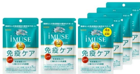
7日分 15日分 28日分

・免疫の重要性を分かりやすく伝達するために、「キリン iMUSE プラズマ乳酸菌 サプリメント」7日分を10月中旬から、15日分を10月下旬から「免疫ケア」の文字を大きくあしらったパッケージにリニューアルします。 商品パッケージに加え、商品売り場の什器にも「免疫ケア」を大きく打ち出すことで、健康維持に関心の高い方の行動変容を促します。また免疫ケアへの関心が高い方のまとめ買い需要に対応し、「キリン iMUSE プラズマ乳酸菌 サプリメント 28日分」（7日分×4袋）も本日より発売します。