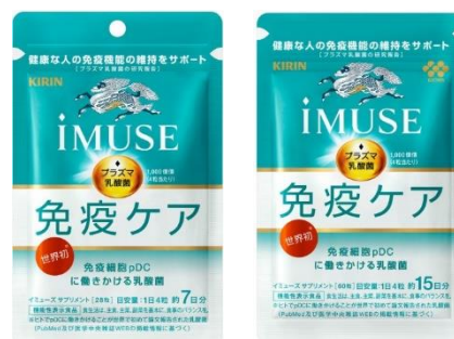
① 7 日分