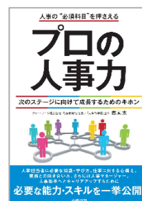
2019年3月発行 労務行政