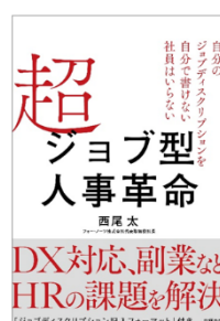
2021年3月発行 日経 BP