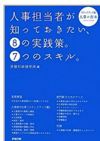
2010年8月発行 労務行政