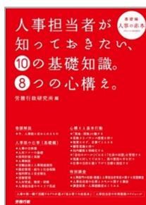
2010年7月発行 労務行政