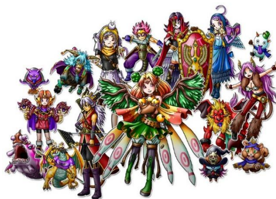
召喚できる魔者一覧