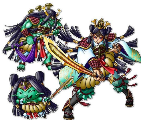
ヤマトタケル イメージ

<開催期間> 2014年6月1日(日) 12:00 ～ 6月6日(金) 23:59