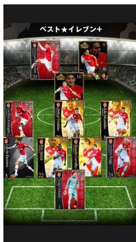
フォーメーション イメージ