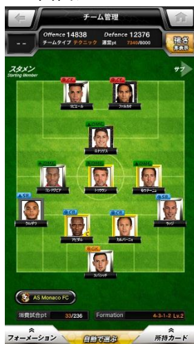
チーム管理 イメージ