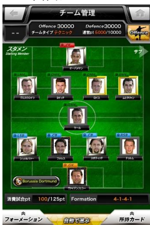
チーム管理 イメージ