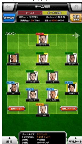
チーム管理 イメージ