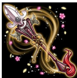
限定魔具「会津若松城ノ槍」