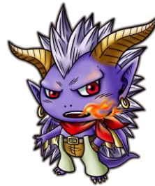
スカイロックコラボ武将「バハムート」