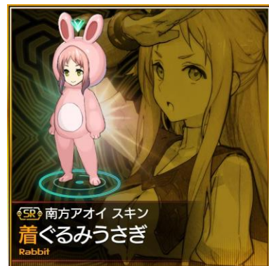
先行ガチャ特典「南方アオイ」限定スキン(全3種類)

※ 事前登録特典および先行ガチャ特典は、全サイトを通じて各1回のみ獲得できます。複数サイトで重複して獲得することはできませんので、ご注意ください。