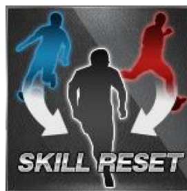
「スキルリセット」アイテム

「スキルリセット」アイテムは、バレンタインキャンペーンのログインボーナスとしてプレゼントするほか、サポートコイン※2を使用して購入することもできます。