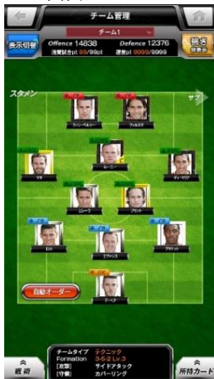
チーム管理 イメージ