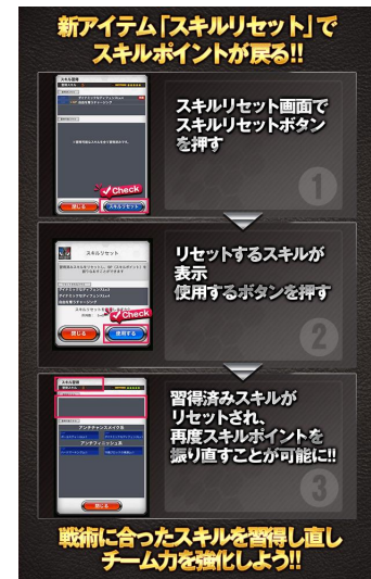
「スキルリセット」概要