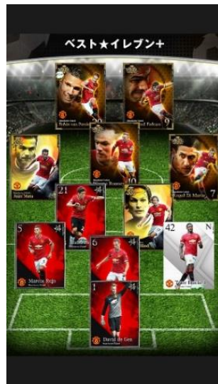
フォーメーション イメージ