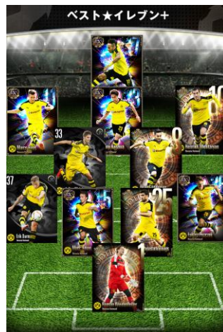
フォーメーション イメージ