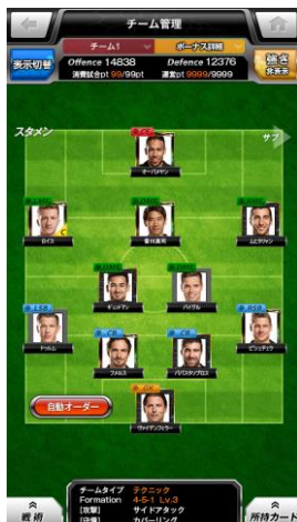
チーム管理 イメージ