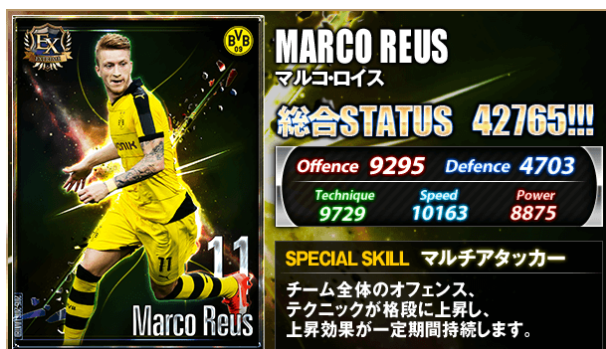
限定カード イメージ