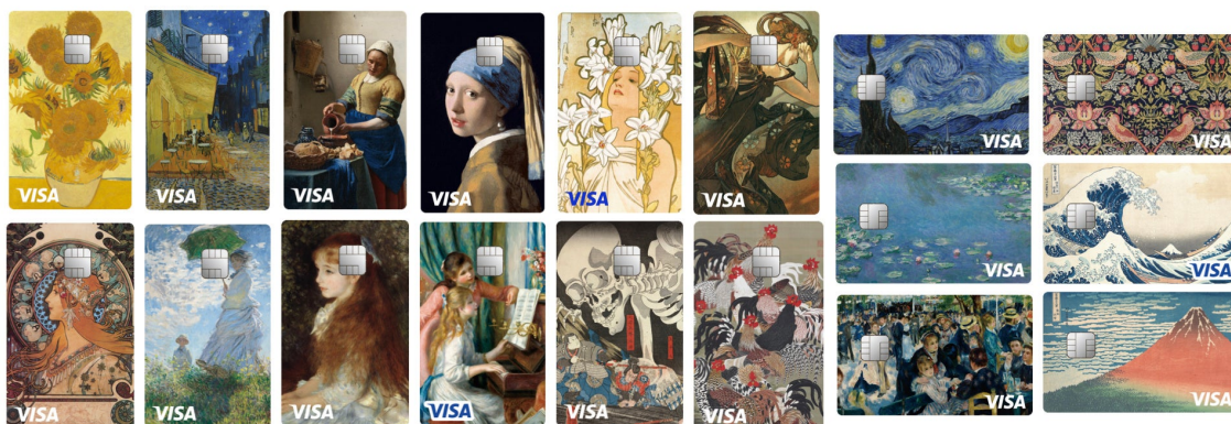
絵画コレクション一覧

ナッジカード 絵画コレクションは、Visaのタッチ決済とナンバーレスに対応しています。タッチ決済は、専用端末にカードをかざすだけで支払いができる便利な機能です。ナンバーレスのクレジットカードは、カード券面にカード番号や有効期限などの記載がなく、カードの情報が盗み見られるなどの心配がありません。カード番号などは、ナッジカードのアプリから確認できます。