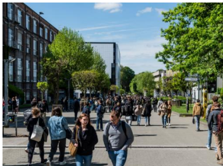
海外出身者でにぎわう ブリュッセル自由大学のキャンパス

ミラノ工科大学（学長：ドナテッラ・シュート）は、1863年に設立されたイタリア有数の国立大学で、とくに工学やデザイン、建築分野で国際的に高い評価を受けています。QS世界大学ランキング2024年版においてイタリアで第1位、世界で111位の大学です。分野別ではアート&デザイン、建築学/建築環境で共に世界7位を誇ります。ミラノ市内外に7つのキャンパスを持ち、世界中から学生や研究者が多く集まることも特徴です。