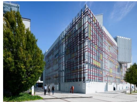
スタイリッシュな ミラノ工科大学のキャンパス