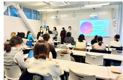
2023年の『社会連携を学ぶ』授業の様子

明治の広報部メンバーが外部ゲストとして参加した2021年度、2022年度のJWU社会連携科目「社会連携を学ぶB」での授業において、社会課題の解決を目指す新たな食育活動として「大学生にとっての食を通じたケア」を明治に提案したことがチーム発足のきっかけとなりました。