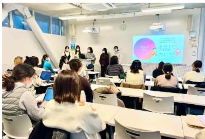
2023 年の『社会連携を学ぶ』授業の様子

明治の広報部メンバーが外部ゲストとして参加した 2021 年度、2022 年度の JWU 社会連携科目「社会連携を学ぶ B」での授業において、社会課題の解決を目指す新たな食育活動として「大学生にとっての食を通じたケア」を明治に提案したことがチーム発足のきっかけとなりました。