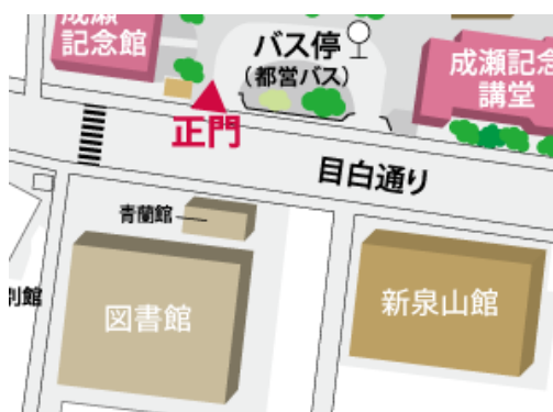
キャンパスマップ（青蘭館は図書館前の建物です）